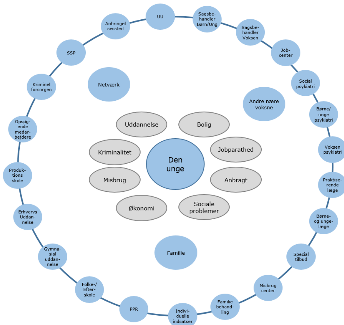
Figur 2 Fagpersoner involveret i den unges sag